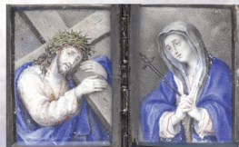
Università della Preghiera, L'Addolorata con il figlio che porta la croce , '600 napoletano Dittico acquarello con cornice 9 cm x 6cm